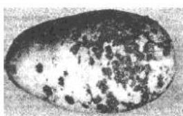
Рисунок 2 - Парша сетчатая (поражено 33,3% поверхности клубня)