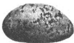
Рисунок 4 - Ризоктония (поражено 10% поверхности клубня)

При определении поражения клубней паршой серебристой учитывают только клубни, потерявшие тургор, сморщенные, а также клубни, имеющие повреждение глазков.