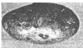
Рисунок 3 - Парша порошистая (поражено 10% поверхности клубня)